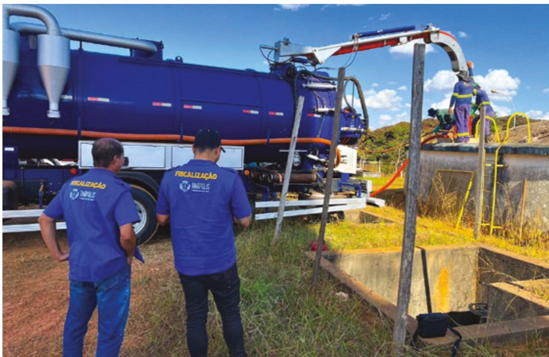
A higienização é um dos fatores fiscalizados, com intuito de garantir água limpa e com qualidade às residências

Na atividade da última segunda-feira os fiscais percorreram nove bairros da cidade para avaliar todo o processo de coleta e monitoramento. Os pontos de coleta foram indicados pela ARM, que levou em conta as reclamações recebidas pela ouvidoria do ór-