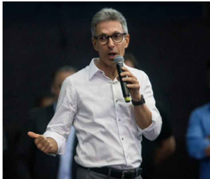
Romeu Zema: apoio aos nomes do Novo em Goiás