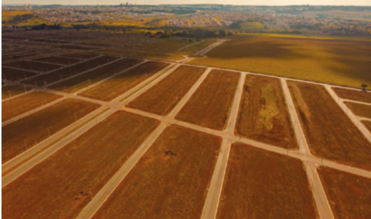
Troca das áreas facilita adaptação às necessidades específicas de cada família

Segundo informações da prefeitura, solicitação do processo pode ser feita pelo Zap 24h