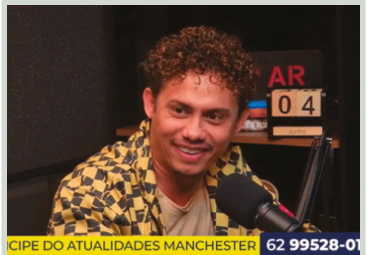
Silvero Pereira, de obras como ‘Serra Pelada’, ‘Bacurau’ e ‘Pantanal’

Ele destaca que, se há um desejo, um sonho, o que vem em primeiro lugar é a dedicação aos estudos. Lembrou o que aprendeu com os pais: “a maior herança que a gente pode deixar para vocês é o estudo, isso é algo que ninguém vai tirar”. Além do workshop, Silvero terá um encontro com convidados e imprensa, na manhã desta quarta-feira, 5, para um bate papo. A agenda do ator continua cheia durante a tarde e, na parte da noite, apresenta a Noite de Gala da Cultura Anapolina, que irá premiar artistas de diversas áreas, no Cine Prime, no Anashopping.