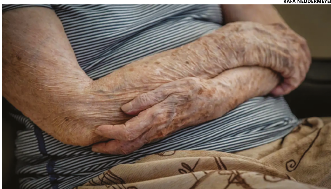
Diabetes na pessoa idosa podem ser potencializadas por fatores como sedentarismo e dieta inadequada

Uma das principais preocupações quando se trata do diabetes na pessoa idosa é o risco aumentado de complicações relacionadas. Entre elas, estão os problemas cardiovasculares, como hipertensão arterial, doença coronariana e acidente vascular cerebral (AVC);