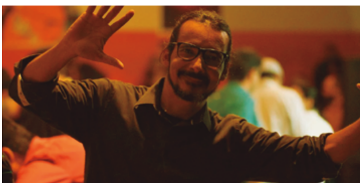
Destaque das honrarias da noite é Prêmio Cesinha de Cultura, in memoriam

e idealizador da noite de premiações, conta que “este evento tem como objetivo fortalecer o espaço do Cine Prime como uma porta para a cultura anapolina e para a cidade, se transformando em um centro de convenções que evidencie a potência dos fazedores de arte da cidade”. De acordo com ele, a Território e os parceiros da ação se colocam de forma a incentivar, fomentar e buscar de alguma maneira unir a classe cultural.