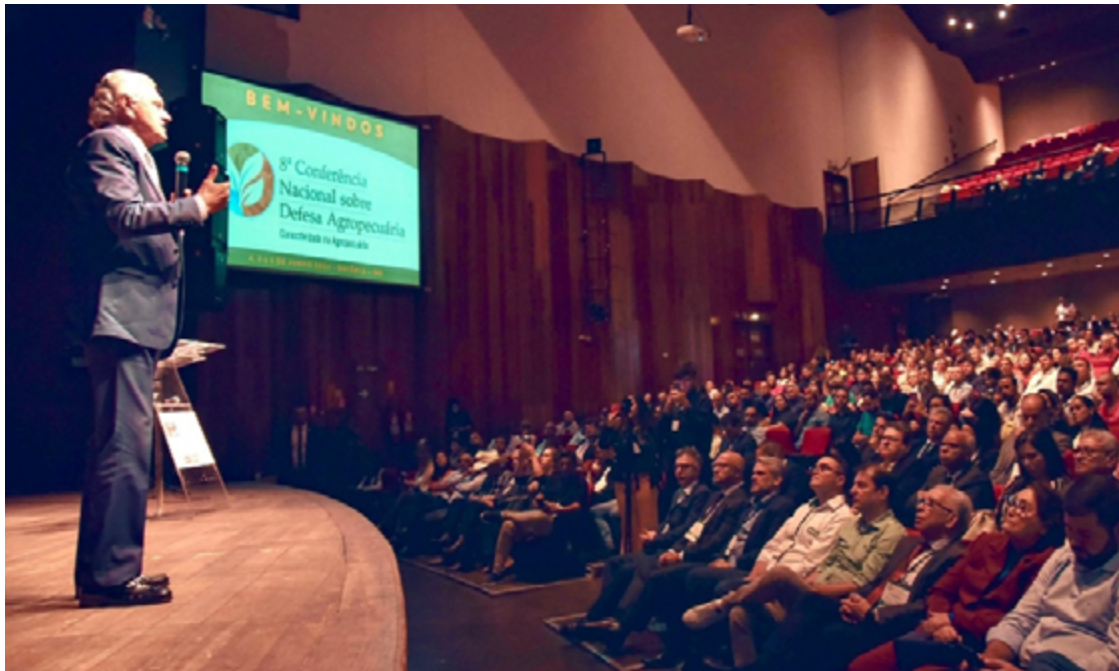
Governador Ronaldo Caiado fala na Conferência Nacional sobre Defesa Agropecuária: “Temos que respeitar a natureza e fazer a evolução da produtividade com controle e pesquisa”