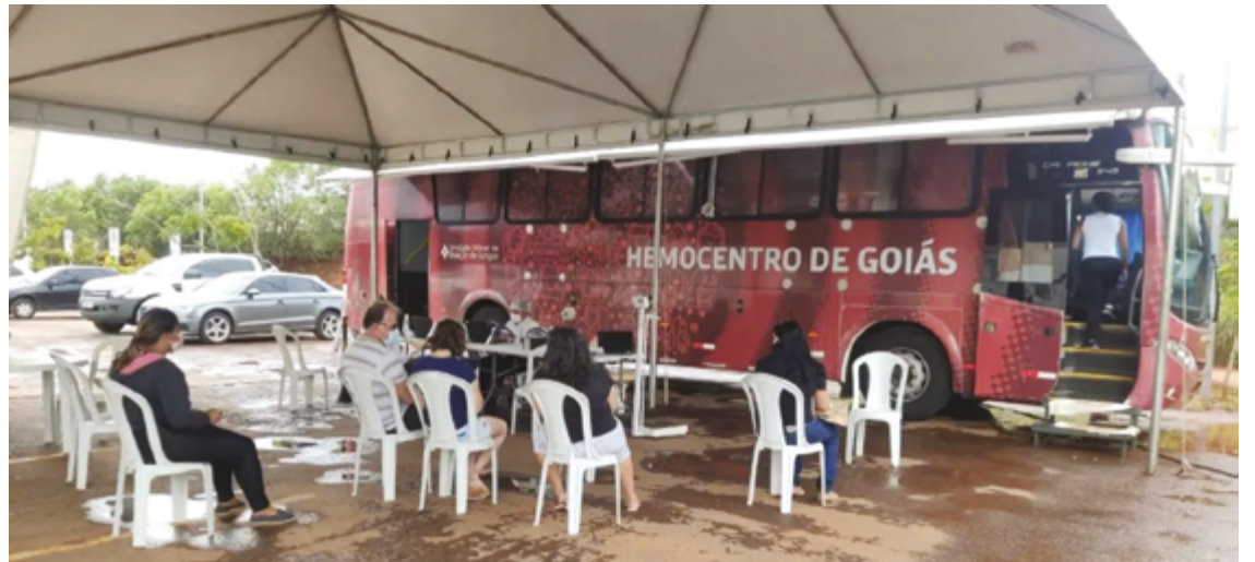
Campanha é parceria do Hemocentro com o Hospital Estadual de Anápolis Dr. Henrique Santillo (Heana) e Funev

Além disso, a profissional destaca que uma bolsa de sangue pode salvar até quatro vidas. “Se alguém quiser fazer doação, não necessariamente no dia da campanha, caso tenha um paciente [conhecido] internado conosco, a doação tem que ser no Hemocentro, que já direciona. Pode chegar e dizer que está doando para tal pessoa, internada em tal hospital”, concluiu.