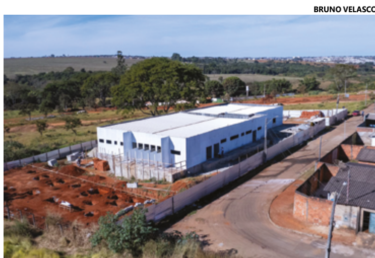
Área total da UPA Veterinária tem quase 2 mil m² e 841 m² de área construída

Segundo informações da Secretaria Municipal de Obras, Serviços Urbanos e Meio Ambiente, para a construção da unidade são investidos R$ 3,764 milhões. Está localizada no Parque Residencial das Flores e foi projetada para oferecer um atendimento completo e de qualidade aos animais. Também terá ambientes para a espera e para hospedagem