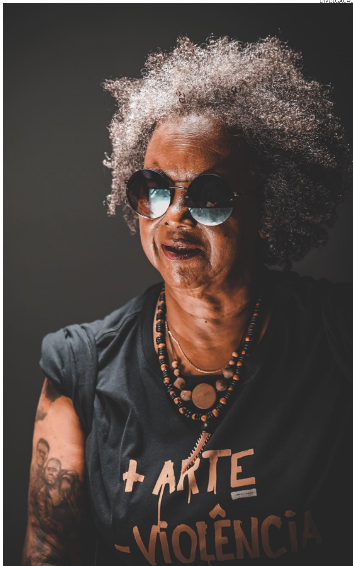
Apresentação será passeio pela vasta discografia da artista, iniciada nos anos 80