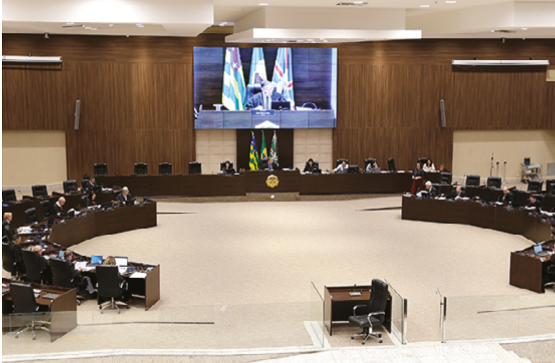
Campanha é do Núcleo Permanente de Métodos Consensuais de Solução de Conflitos e Cidadania (Nupemec)