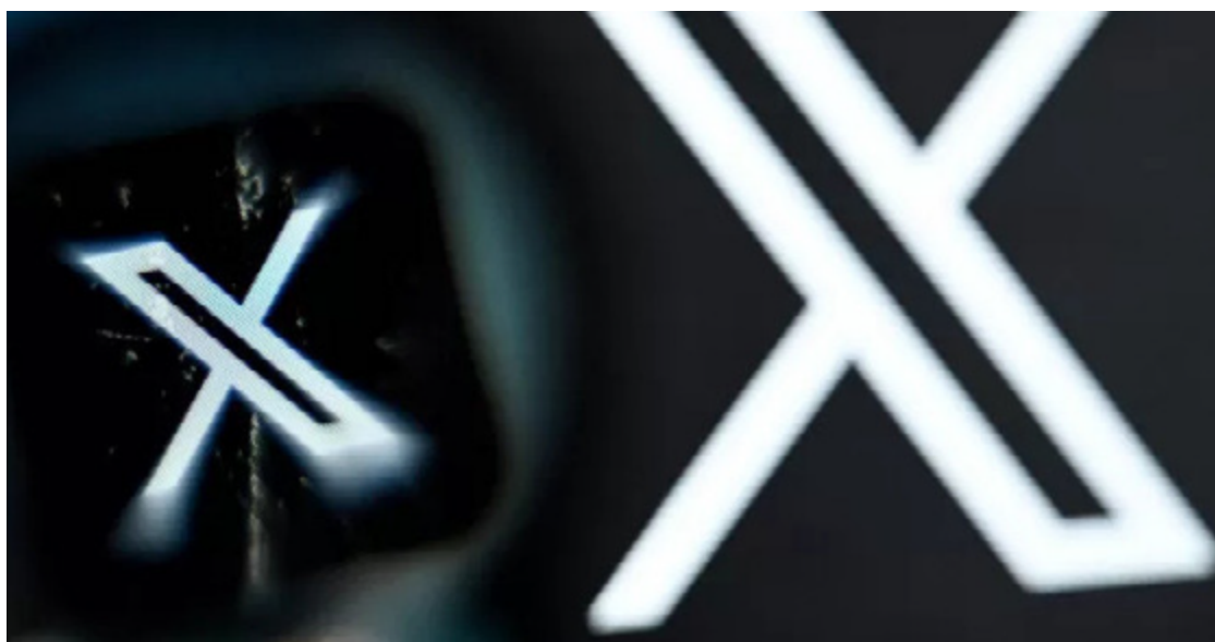
Rede social não havia banido vídeos ou fotos eróticas, mas também não as havia autorizado oficialmente

"Acreditamos que os usuários devem poder criar, distribuir e assistir a conteúdos sexuais desde que sejam produzidos e distribuídos de forma consensual", indica a rede na página intitulada "conteúdos adultos" de seu regulamento atualizado. X assegura, no entanto, "impedir que esses conteúdos sejam visíveis por